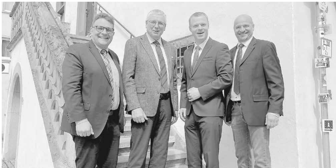
Roman Menth 1. Bürgermeister Aub

Für den persönlichen Austausch stehen wir unseren Mitbürgerinnen und Mitbürgern selbstverständlich jederzeit gerne zur Verfügung. Kommen Sie gerne auf uns zu.